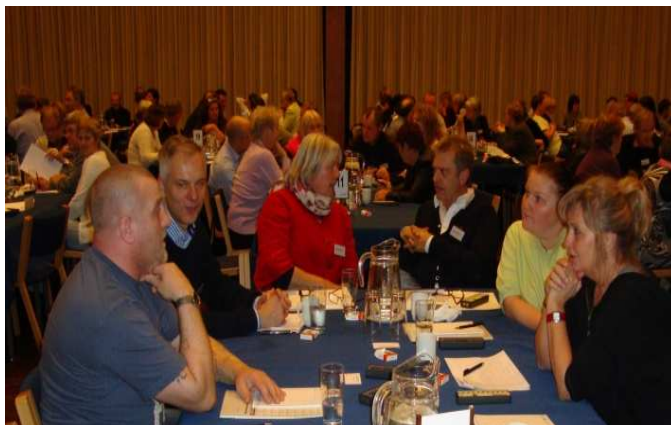
Billeder fra TLs Repræsentantskabsmøde - med nogle af afdelingens delegerede