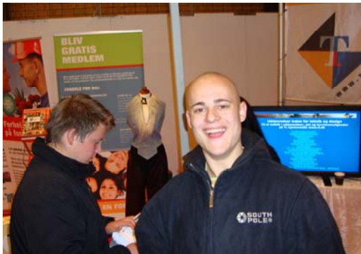
Fra TLs stand i Hillerød

Udover i Hillerød deltog afdelingen også i en uddannelsesmesse i Roskilde den 1. december 2011.