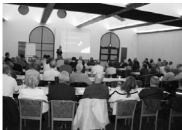
Nogle af deltagerne ved pensionsaftenen i Køge

Der blev på mødet opfordret til, at den enkelte pensionskunde med pension hos PFA-Pension kontakter afdelingen eller PFA for at få aftalt et personligt rådgivningsmøde med en rådgiver fra PFA.